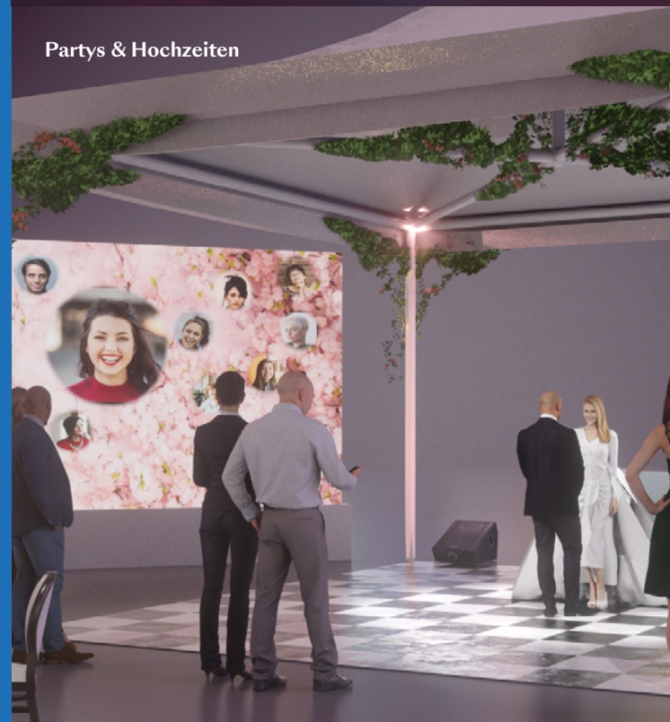
Partys & Hochzeiten