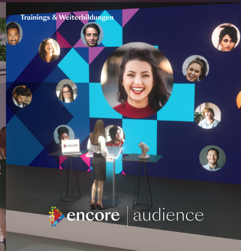
Trainings & Weiterbildungen