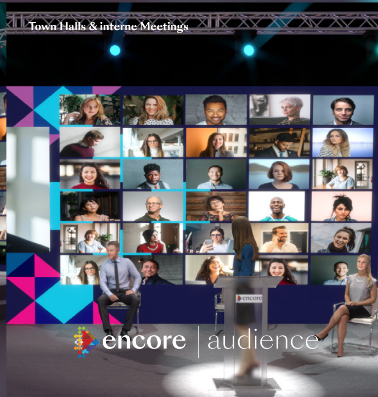
Town Halls & interne Meetings